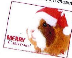
Demy en Kyana

ik ik vond ik vond het ik vond het leuk ik vond het leuk om ik vond het leuk om cadautjes ik vond het leuk om cadautjes uit ik vond het leuk om cadautjes uit te pakken